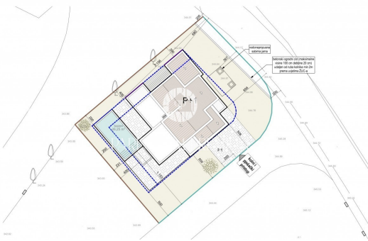
TLOCET PRIZEMLJA skala 1:500

Für weitere Informationen und die Organisation von Besichtigungen stehen wir Ihnen gerne zur Verfügung.